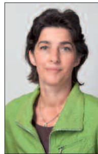
NRW-Gesundheitsministerin Barbara Steffens

Die Landesregierung hat neue Rahmenvorgaben für die circa 400 Kliniken in Nordrhein-Westfalen vorgelegt. Das Ministerium leitete kürzlich den „Krankenhausrahmenplan 2015“ dem Gesundheitsausschuss des Landtags zu. Für drei Versorgungsbereiche hat NRW-Gesundheitsministerin Barbara Steffens darin detaillierte Kriterien definiert: So sollen altersspezifische Erkrankungen bei Menschen ab dem 75. Lebensjahr bei der Aufnahme ins Krankenhaus mittels Screening besser erkannt werden. Ergeben sich dadurch Hinweise „auf ein vermindertes Erinnerungsvermögen, eine Häufung von Krankheiten oder Hilfs-