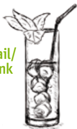
1 Cocktail/ Longdrink 0,3 l