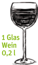
1 Glas Wein 0,2 l