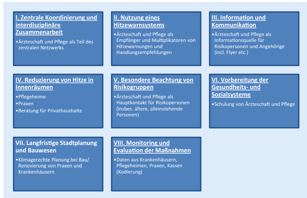
Abb. 1 ▲ Beispielhafte Rollen der Ärzteschaft und Pflege in den 8 Kernelementen von Hitzeaktionsplänen. (Nach Bund/Länder Ad-hoc Arbeitsgruppe [46])

Bundesgesundheitsministerium geförderten Projekt in mehreren Expertenworkshops entwickelt wurden [53]. Bei den Empfehlungen zu Präventionsmaßnahmen ist zu beachten, dass es sich aufgrund der nichtausreichenden Studienlage zur Evaluation dieser Maßnahmen überwiegend um Empfehlungen der Evidenzgrade III und IV handelt.