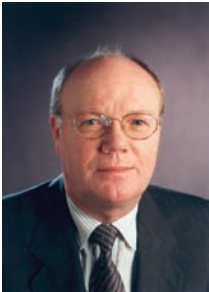
Werner Leonhardt Beigeordneter Leiter des Kriminalpräventiven Rates der Landeshauptstadt Düsseldorf